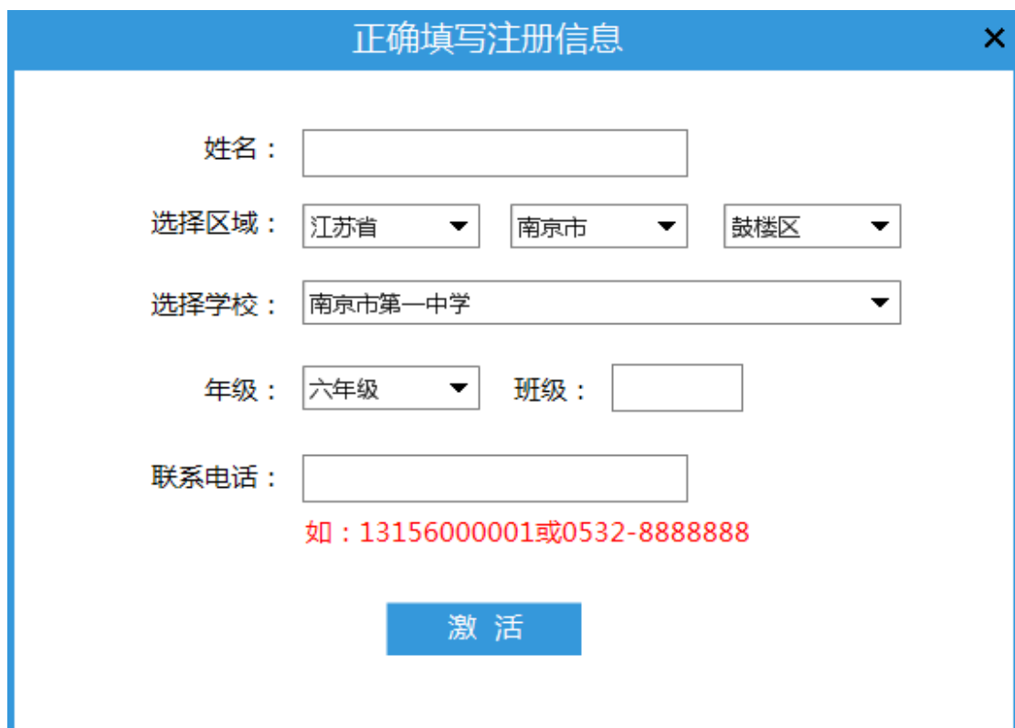
(此图为新版最新图)

2. 如果电脑可以联网，则可以选择“在线激活”按钮，进入用户信息填写界面（ 请认真填写，此信息将会作为享受后续服务的重要依据 ）后，点击“注册”即可进行激活。